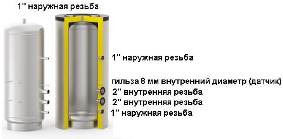
Схема бака серии AT ELECTRO